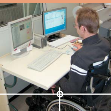
Grafik und Layout